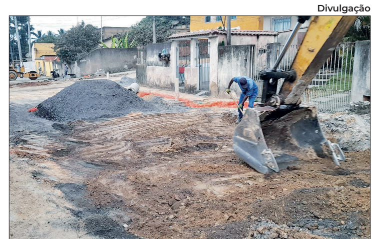
Obra era para inserir novas galerias de escoamento

A Defesa Civil foi contatada na quarta-feira (8) e, segundo os moradores da rua, o comunicado foi de que não havia riscos, mas que iria acionar a Secretaria Municipal de Obras para investigação dos danos. Na última sexta-feira (10) a calçada de mais um morador cedeu completamente e chegou a abrir rachaduras dentro de sua casa.