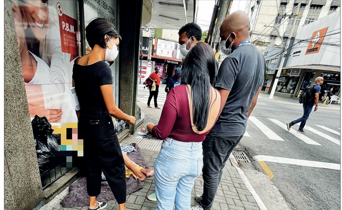
Moradores em situação de rua são abordados em Volta Redonda

Com funcionamento de segunda a sexta-feira, das 8h às 20h, o Centro Pop oferece aos usuários café da manhã, almoço, jantar, banho, espaço para lavagem de roupas e enca-