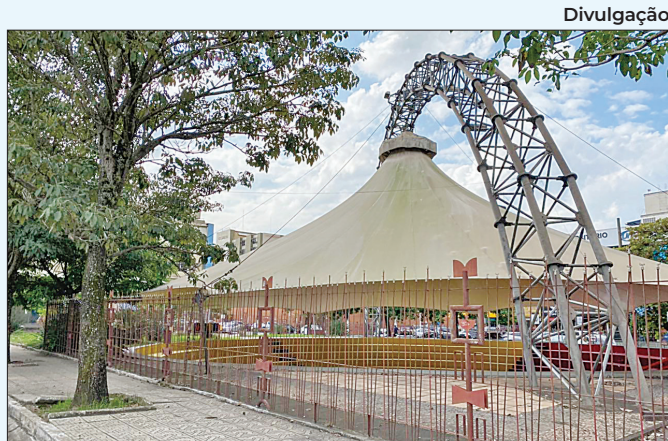
Evento faz parte da agenda do Ministério da Cultura

ciado pelo Movimento Sul Fluminense Contra a Poluição que foi agendada uma audiência sobre a CSN com a Comissão de Legislativa Participativa, em Brasília, para junho deste ano.